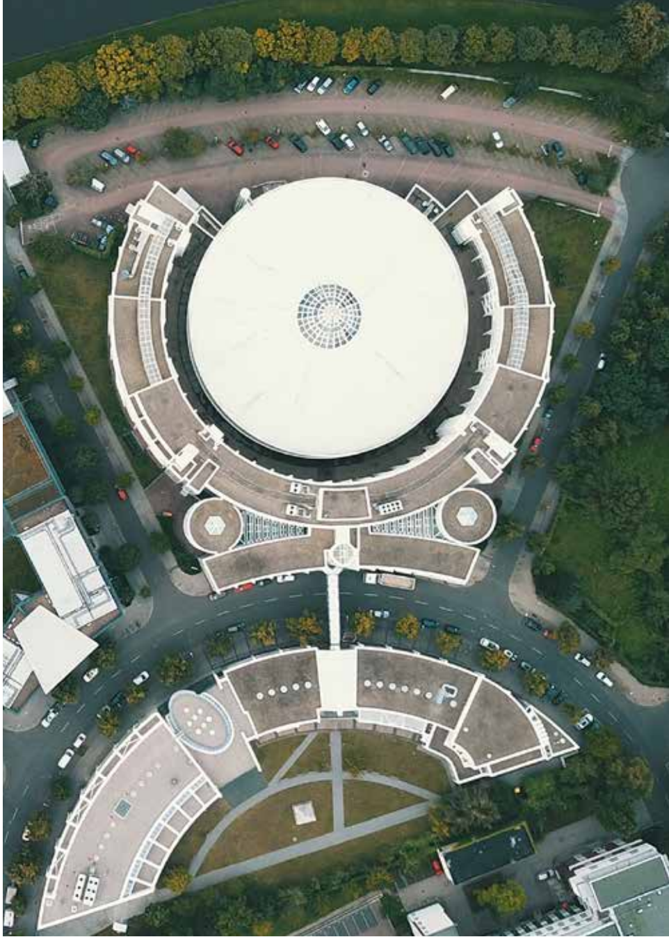
1 Ansicht von oben – Maschinenhalle mit umgebendem Bürotrakt am Standort Berlin.