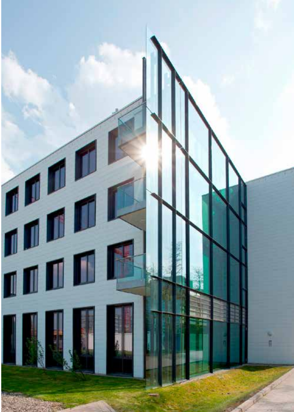
1 Institutsgebäude mit großflächiger Glasfassade am Standort Kaiserslautern.